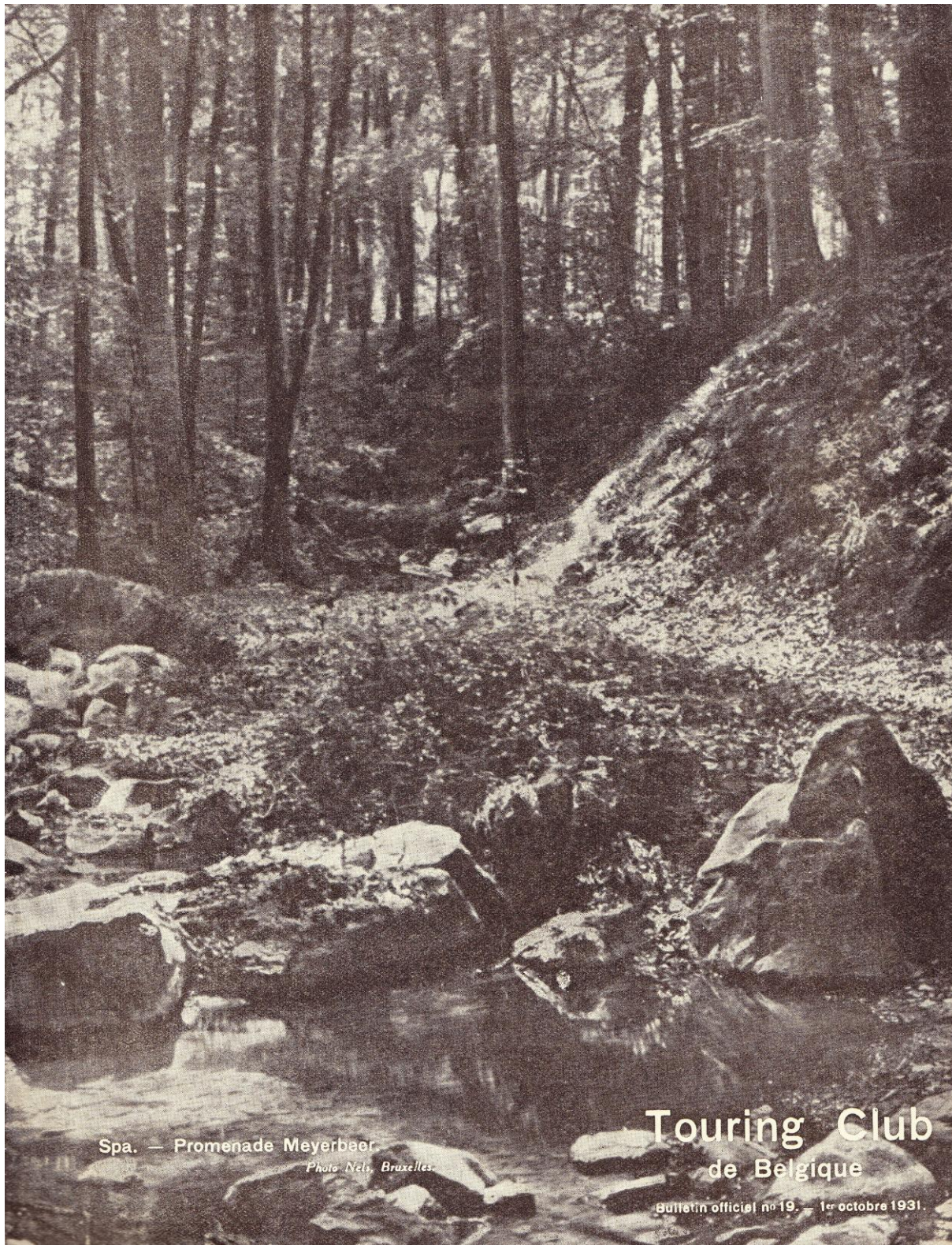
Spa. — Promenade Meyerbeer.

Vous trouverez ci-dessous le sommaire du N°19 du 1 er octobre 1931 du Bulletin officiel du Touring Club de Belgique.